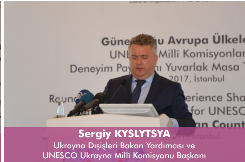
Sergiy KYSLYTSYA Ukrayna Dışişleri Bakan Yardımcısı ve UNESCO Ukrayna Milli Komisyonu Başkanı