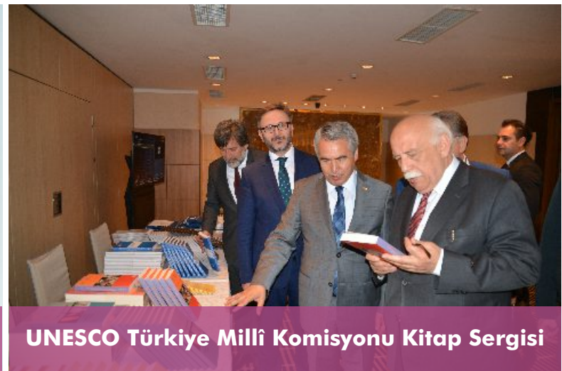
UNESCO Türkiye Milli Komisyonu Kitap Sergisi